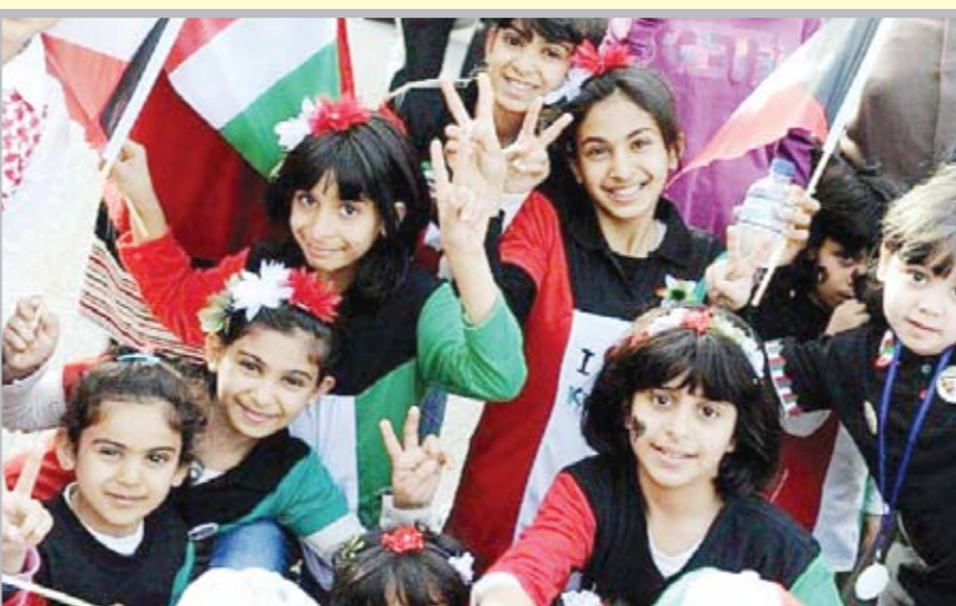
الأطفال وبهجة الاحتفالات