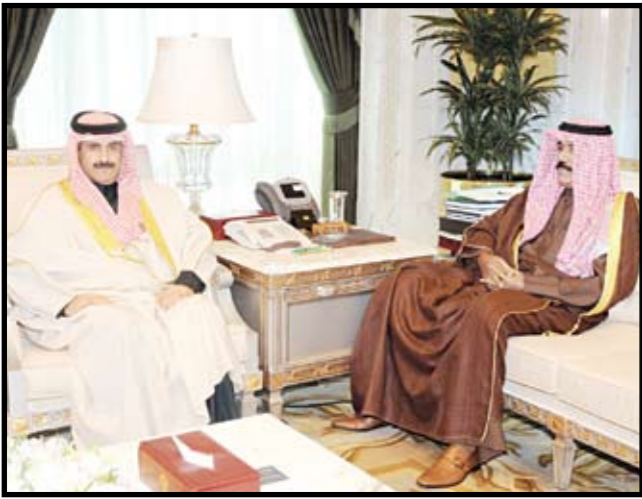
سمو ولي العهد الشيخ نواف الأحمد مستقبلا الشيخ مبارك دعيج الإبراهيم الصباح

وحدث سموه أبناءه الطلبة على بذل مزيد من الجهد والمثابرة في تحصيلهم العلمي للحصول على أعلى الشهادات العلمية: ليسهموا في مسيرة التقدم والرفق لوطنهم، وبناء مستقبله المشرق تحت ظل القيادة الحكيمة صاحب السمو أمير البلاد، مطالبا سموه أبناءه الطلبة بأن يكونوا على قدر المسؤولية، وأن يتركوا صورة جيدة للشباب الكويتي الملتزم بدينه وقيمه وتاريخه، وأن يكونوا خير سفراء لبلدهم في المحافل الدولية، داعيا إياهم إلى الانشغالوا بغير التحصيل العلمي لتحقيق أهدافهم العلمية، متمنيا لهم كل التوفيق والنجاح. واستقبل سمو ولي العهد الشيخ نواف الأحمد، بقصر السيف صباح أمس، الشيخ سالم عبدالعزیز السعود الصباح، واستقبل سموه رئيس جهاز الأمن الوطني الشيخ ثامر علي صباح السالم الصباح، كما استقبل سمو ولي العهد رئيس مجلس الإدارة المدير العام لوكالة الأنباء الكويتية (كونا) الشيخ مبارك دعيج الإبراهيم الصباح.