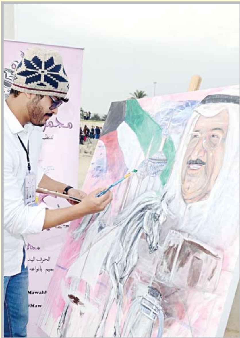
صور صاحب السمو زينت الاحتفالات