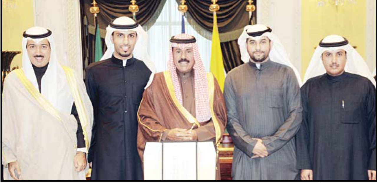
سمو ولي العهد الشيخ نواف الأحمد متوسطا رئيس وأعضاء الهيئة التنفيذية للاتحاد الوطني لطلبة الكويت

استقبل سمو ولي العهد الشيخ نواف الأحمد، بقصر السيف صباح أمس الإثنين، رئيس الهيئة التنفيذية للاتحاد الوطني لطلبة الكويت محمد مشعان العتيبي وأعضاء الهيئة.