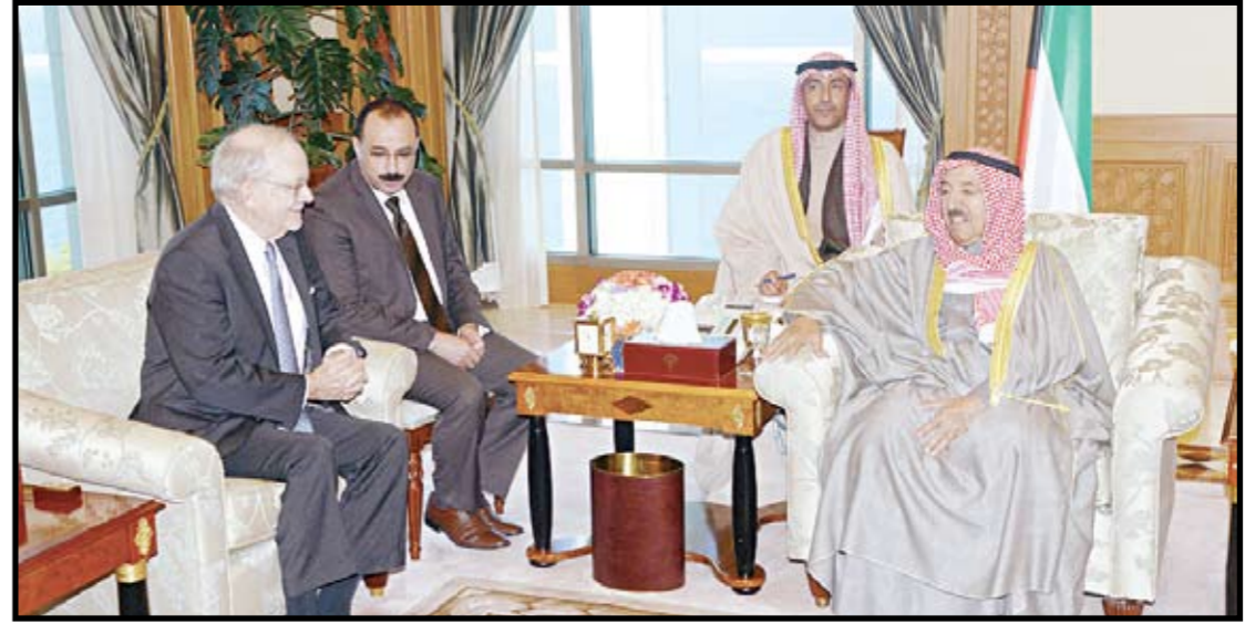
صاحب السمو الشيخ صباح الأحمد مستقبلا المدير التنفيذي لليونسيف أنتوني ليك

استقبل صاحب السمو الشيخ صباح الأحمد، بقصر السيف صباح أمس الإثنين، النائب الأول لرئيس مجلس الوزراء وزير الخارجية الشيخ صباح الخالد، والمدير التنفيذي لليونسيف أنتوني ليك والوفد المرافق، بمناسبة زيارته للبلاد. حضر المقابلة نائب وزير شؤون الديوان الأميري الشيخ علي الجراح.