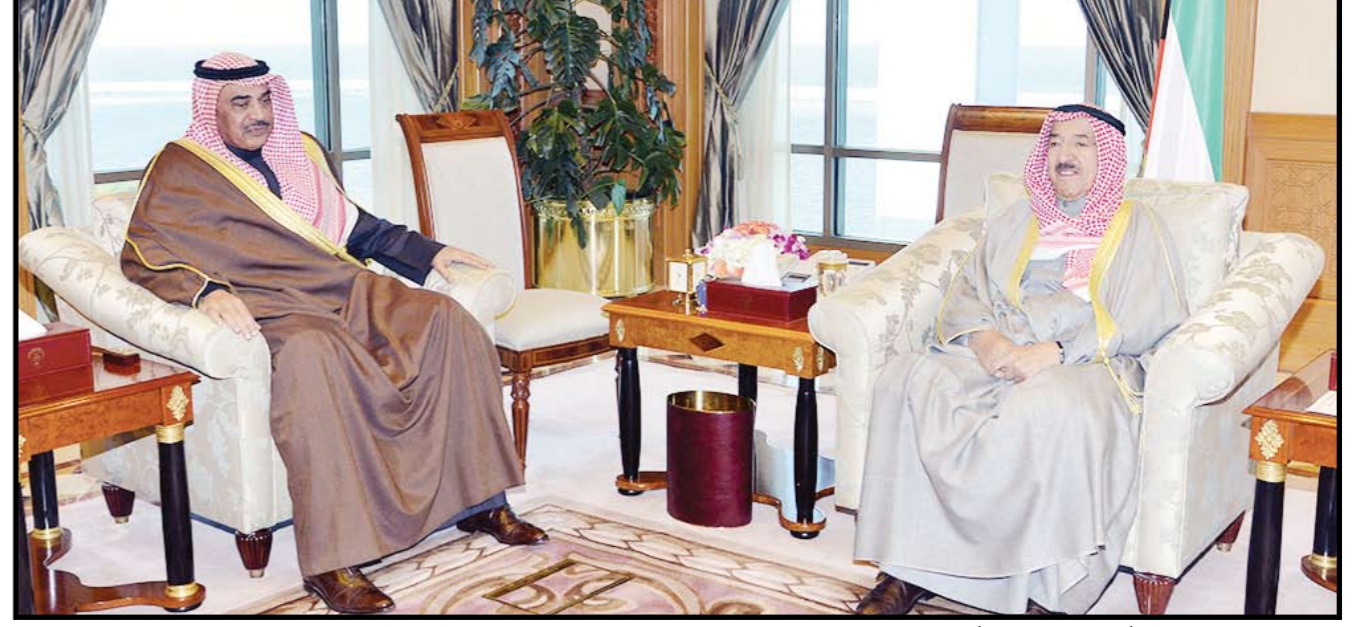
صاحب السمو الشيخ صباح الأحمد مستقبلا النائب الأول لرئيس مجلس الوزراء وزير الخارجية الشيخ صباح الخالد