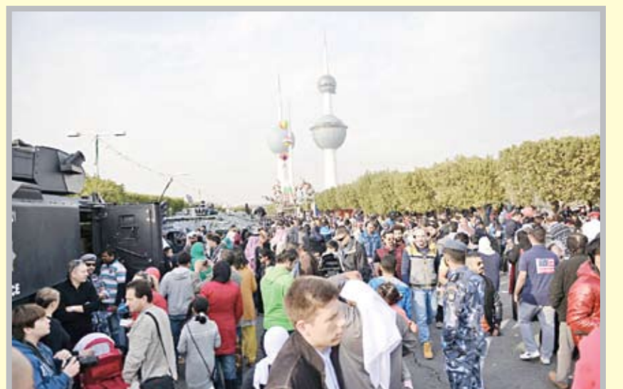
إقبال جماهيري كبير على حضور الاحتفالات