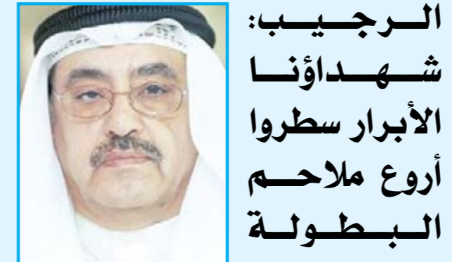
الفريق اول احمد الرجب

أكد وكيل وزارة الأشغال المساعد لقطاع الطرق م. أحمد الحصان أن مشروع إنشاء وإنجاز وصيانة الطرق والتقاطعات على الجزء الغربي من شارع جمال عبد الناصر يعد مرحلة مهمة في أحد أضخم مشاريع البنية التحتية وتطوير شبكة الطرق على الصعيدين الدولي، لافتاً إلى أن «الأشغال مطلوب منها طرح 40 مناقصة منها 34 ستطرح خلال عام 2015، مبيناً أن ميزانية المطلوب للعام 2015/ 2016، لم تعتمد إلى الآن وتتراوح بين 350 و380 مليون دينار، كاشفاً أن المشاريع الحالية تجاوزت قيمتها مليار و400 مليون دينار، وتتتمثل في جسر جابر بقيمة 738 مليون دينار، ووصلة الدوحة بـ 165 مليوناً، وطريق الجهراء بـ 260 مليون دينار وطريق جمال عبد الناصر بـ 240 مليوناً.