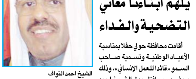
الشيخ احمد النواف

أقامت محافظة حويي حفلاً بمناسبة الأعياد الوطنية وتسمية صاحب السمو «قائدا للعمل الإنساني»، وذلك بحضور محافظ حويي الشيخ احمد النواف وعدد من أعضاء البعثات الدبلوماسية في أرض المعارض بمنطقة مشرف. وقال الشيخ احمد النواف، في كلمة له خلال الحفل: إنه في مثل هذه الأيام يجب علينا أن نذكر شهابنا والأجيال القادمة بالدور الذي قام به شهداؤنا الأبرار الذين ضحوا بدمائهم من أجل ثرى وطننا الغالي، مؤكداً ان دماءهم التي أريقَت ستظل نبراساً يلهم أبناءنا معاني التضحية والفداء والالتفاف حول قيادتنا الحكيمه متمسكين بنهج الأبناء والأجداد، ومحافظين على الترابط والوحدة الوطنية لكي نظل كويتنا الحبيبة واحة أمن.