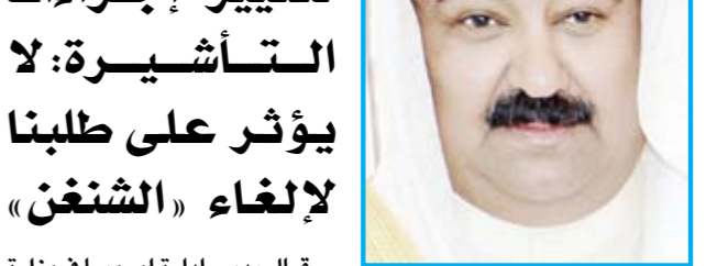
السفير وليد الخبيزي

قال مدير ادارة اوروبا في وزارة الخارجية السفير وليد الخبيزي انهم مقلبون «على المراجعة من قبل الاتحاد الاوروبي بخصوص مسيرة إلغاء تأشيرة الشنغن عن المواطنين خلال الاشهر المقبلة»، مشيراً إلى ان هذا يعتمد على «حسب برنامج البرلمان الاوروبي، وانشغالاته وأولوياته»، مضيفاً «كما اننا ما زلنا بانتظار الاستحقاقات الفنية المنوطة بوزارة الداخلية بشأن اصدار الجواز الالكتروني».