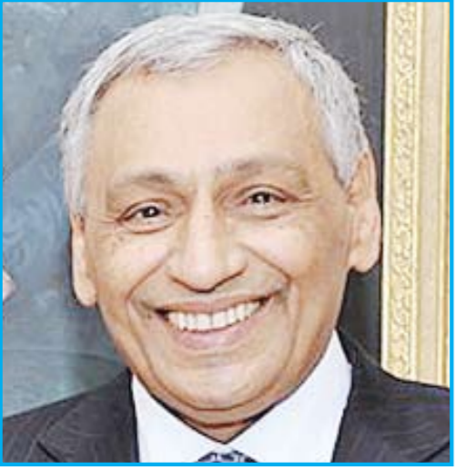
السفير خالد الدويسان