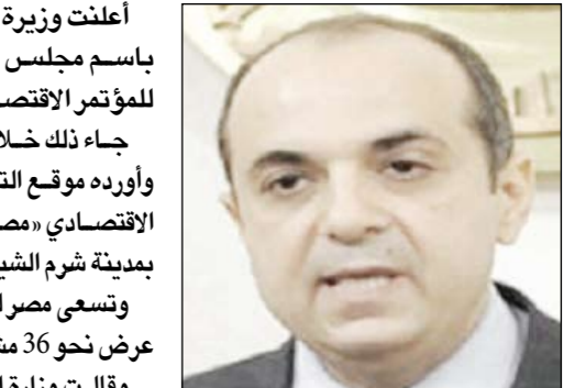
السفير حسام القاويش

أعلنت وزيرة التعاون الدولي نجلاء الأهواني أنه تم تعيين المتحدث باسم مجلس الوزراء، السفير حسام القاويش، متحدثاً إعلامياً للمؤتمر الاقتصادي. جاء ذلك خلال المؤتمر الصحافي الذي عقد اليوم بمقر هيئة الاستثمار، وأورده موقع التلفزيون المصري، للإعلان عن التفاصيل المتعلقة بالمؤتمر الاقتصادي «مصر المستقبل» المقرر إقامته من 13 إلى 15 مارس الجاري بمدينة شرم الشيخ بمحافظة جنوب سيناء. وتسعى مصر لجذب استثمارات تتراوح بين 15 و20 مليار دولار من خلال عرض نحو 36 مشروعاً للاستثمار خلال المؤتمر الاقتصادي. وقالت وزارة الخارجية إن 60 دولة و20 منظمة إقليمية ودولية أكدت حتى الآن مشاركتها في المؤتمر.