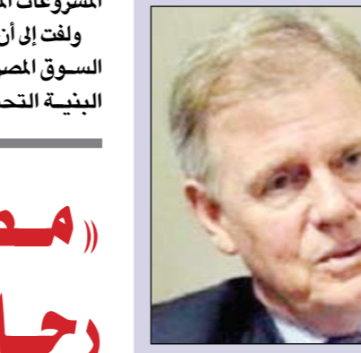
السفير جيمس موران