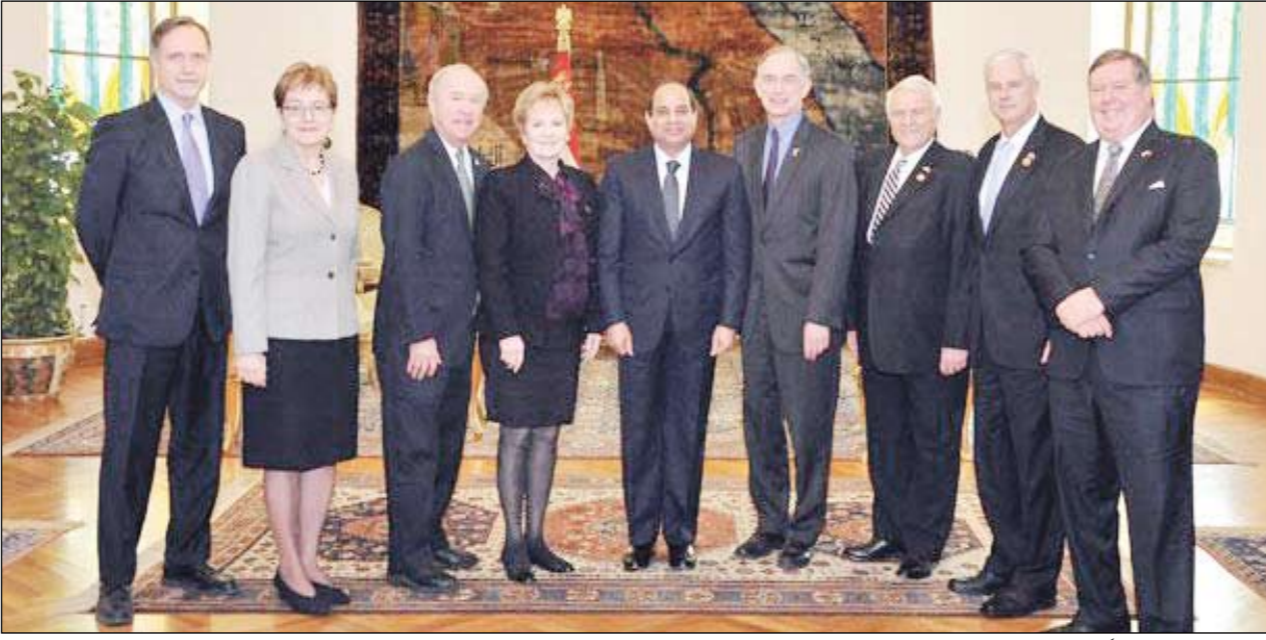
الرئيس السيسي مع أعضاء وفد الكونجرس الأميركي

من الإمكانات التي تمنحها الفرصة للمساهمة في توفير الاستقرار والتقدم للمنطقة وشعبها. كما أوضحوا أنهم سيواصلون دعم مصر داخل الكونجرس الأميركي وتقديم كل المساهمات الممكنة، بما في ذلك على الصعيد العسكري، لدعم مصر في حريتها ضد الإرهاب، سواء في سيناء أو لتأمين الأخطار التي تهدد أمن مصر القومي على حدودها الغربية. ومن جانبه، أعرب الرئيس عن تقدير مصر لموقف أعضاء الكونجرس الأميركي الداعم ولتفهمهم حقيقة الظروف والأوضاع التي تمر بها منطقة الشرق الأوسط، مشيراً إلى اعتراف مصر بعلاقتها الاستراتيجية مع الولايات المتحدة، وحرصها على تمهيتها في مختلف المجالات بما يصب في صالح الدولتين والشعبين المصري والأميركي، لاسيما أن البلدين لديهما تاريخ ممتد من الصداقة والتعاون الوثيق. واستعرض الرئيس مجمل تطورات الأوضاع في مصر على مدار السنوات الأربع الماضية، مشيراً إلى أن ثورة المصريين في الثلاثين من يونيو جاءت معبرة عن إرادة شعبية خالصة، وكانت مدفوعة بالاعتراض على محاولة تغيير هوية الدولة.