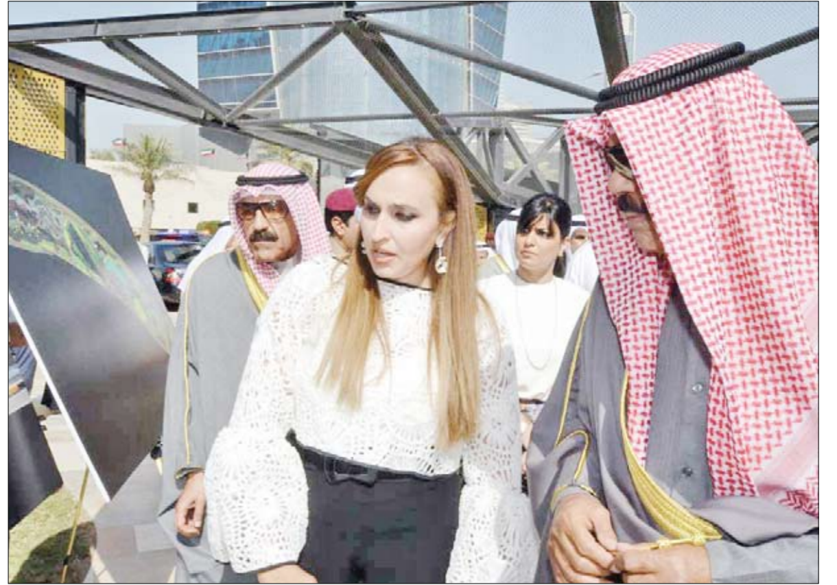
سمو ولي العهد الشيخ نواف الأحمد يطلع على أحد مرافق الحديقة ويبدو الشيخ مبارك الفصيل