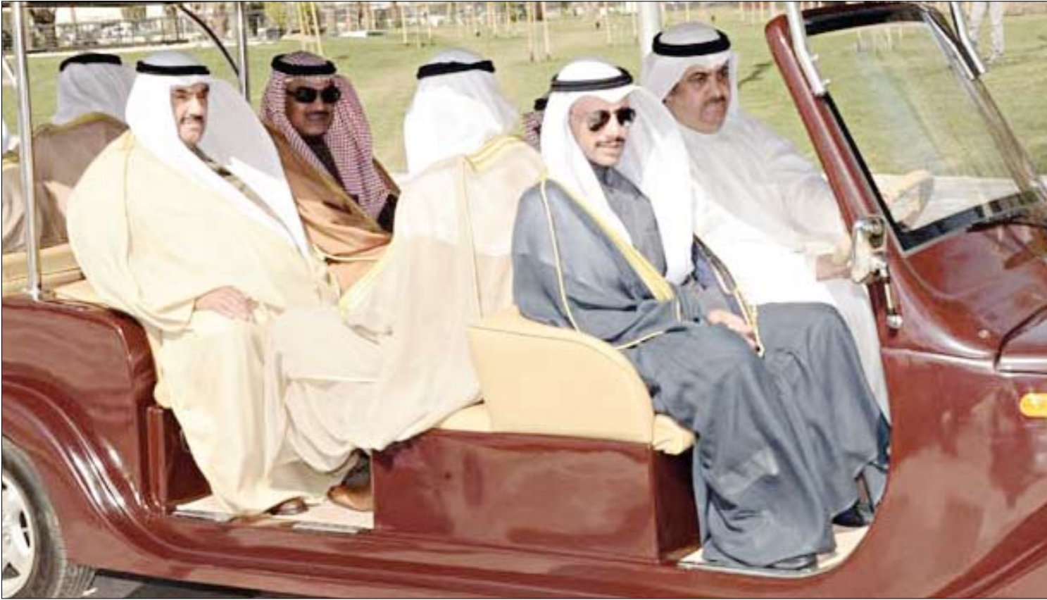
مرزوق الغانم وسمو الشيخ ناصر المحمد والشيخ صباح الخالد وعبد الله الجري

قام صاحب السمو الشيخ صباح الأحمد، وسمو ولي العهد الشيخ نواف الأحمد، بافتتاح مشروع حديقة الشهيد بمنطقة شرق. وقد كان في استقبال سموه نائب وزير شؤون الديوان الأميري الشيخ علي الجراح، ورئيس الشؤون المالية والإدارية بالديوان الأميري عبدالعزيز سعود إسحق. وقد قام سموه، بجولة في أرجاء الحديقة، واستمع إلى شرح من قبل رئيس الشؤون المالية والإدارية حول مرافق المشروع، والذي يظهر المعالم الحضارية للكويت.