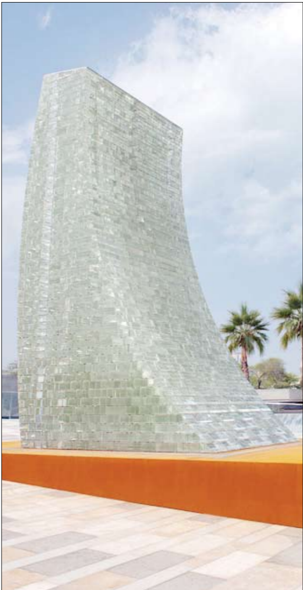
نصب الشهيد في الحديقة