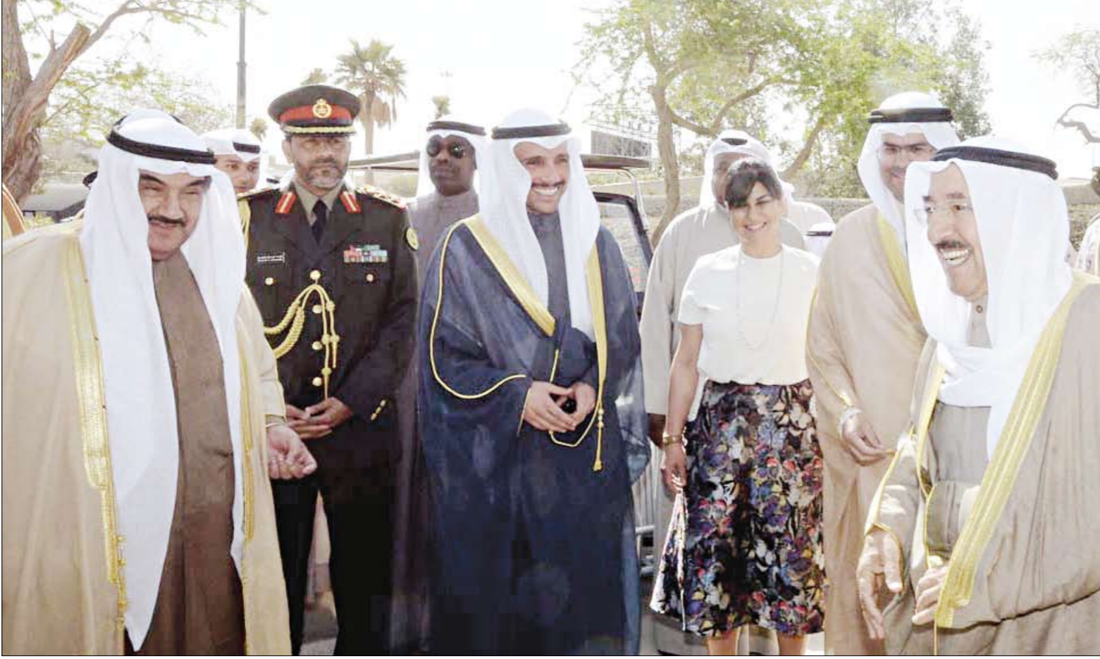
حديث باسم بين صاحب السمو الشيخ صباح الأحمد ومرزوق الغانم وسمو الشيخ ناصر المحمد وعبد العزيز إسحق