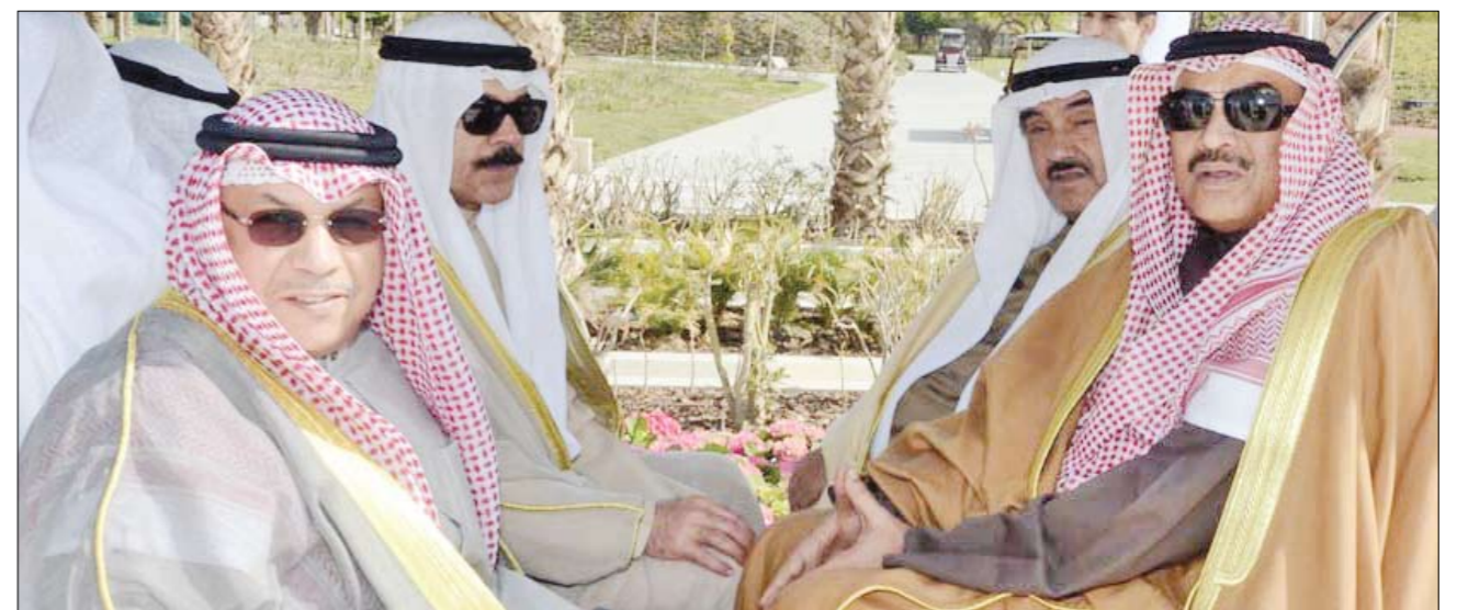
سمو الشيخ ناصر المحمد والشيخ صباح الخالد والشيخ محمد الخالد والشيخ خالد الجراح